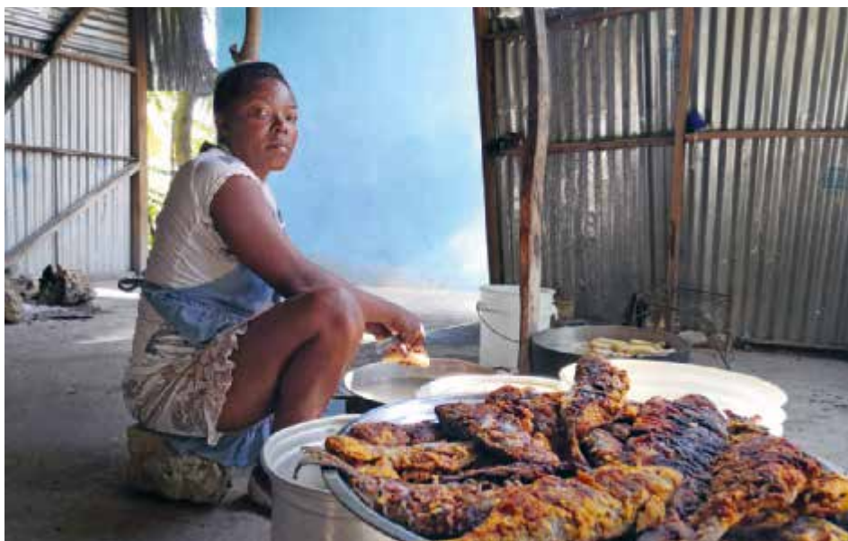
Nach dem Erdbeben, das Haiti am 14. August 2021 erschütterte, wurden täglich 2500 Mahlzeiten an die Opfer verteilt.