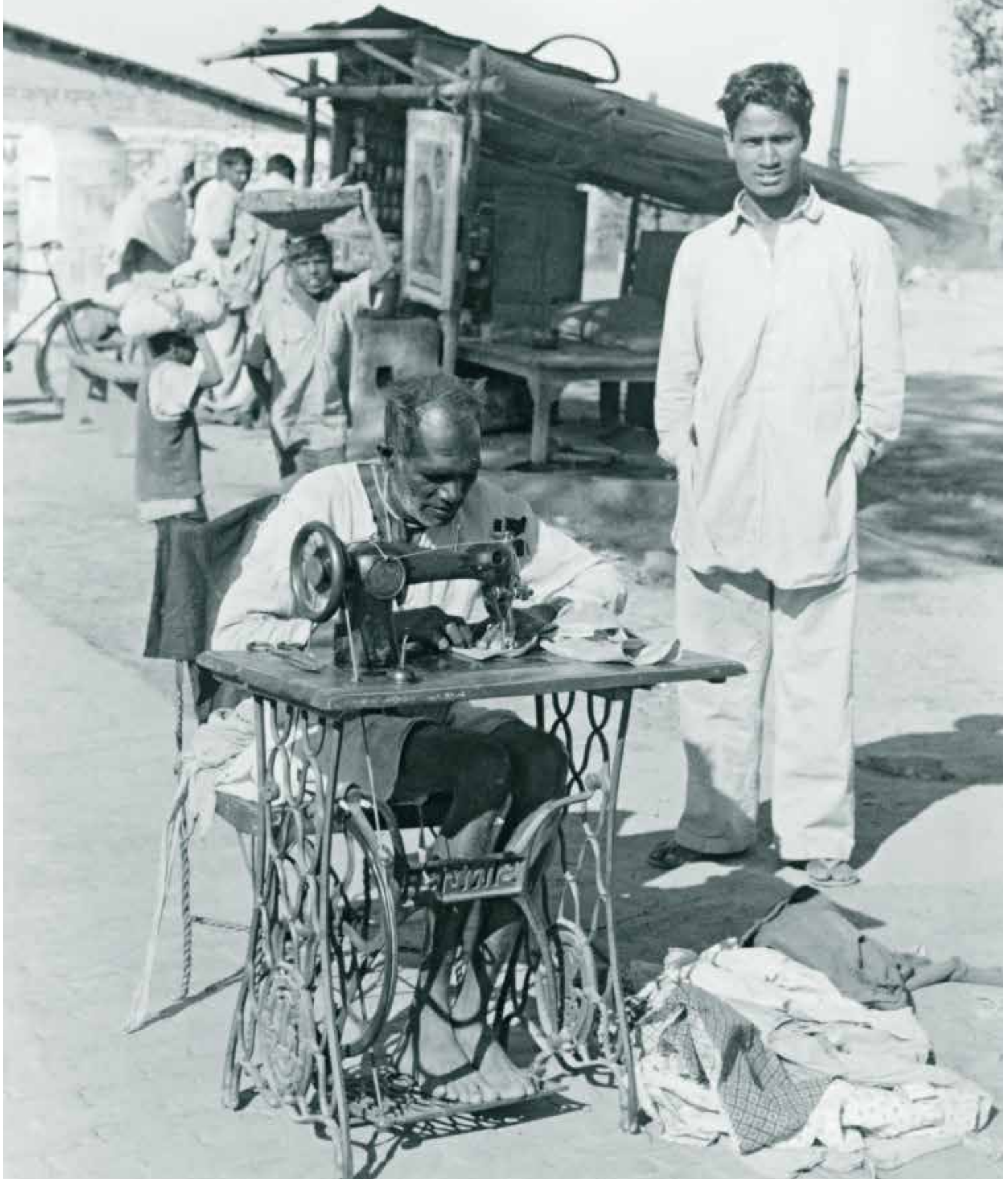
Indien, 1967 – Ein Schneiderlehrling lernt den Umgang mit einer Nähmaschine 1958 startete HEKS sein erstes Entwicklungsprojekt in Südindien. Es war eine Werkstatt für Werkzeugmacherlehrlinge. Das Projekt wurde zuerst von den kirchlichen Geldgebern nicht akzeptiert, weil die Zielgruppe keine Christen waren. HEKS erachtete es jedoch als nicht verhandelbare Bedingung, dass das Projekt für alle offen sein sollte, unabhängig von Herkunft und Religion. Die daraus entstandene Ausbildungsstiftung, Nettur Technical Training, wurde 1982 finanziell unabhängig.